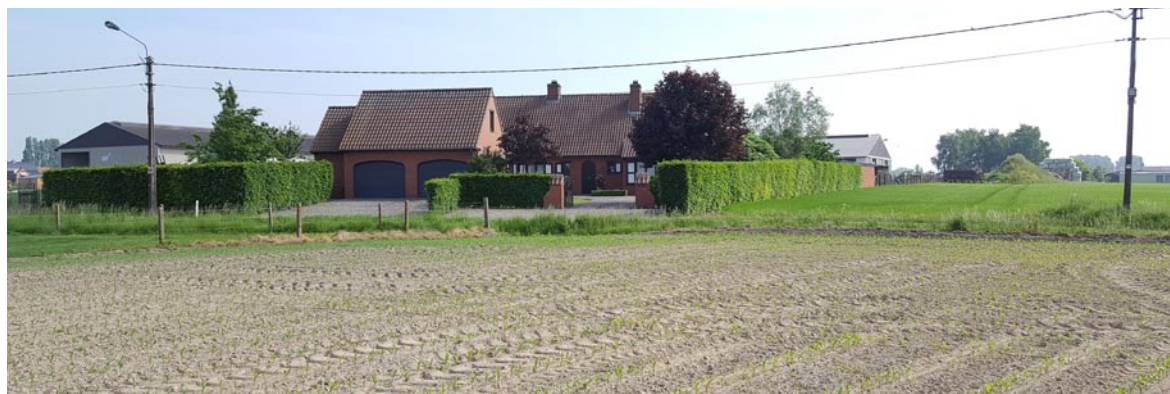
De oude woning die je op de bovenste foto ziet is gebouwd na 1856 want ze staat nog niet op de Poppkaart uitgegeven in dat jaar .